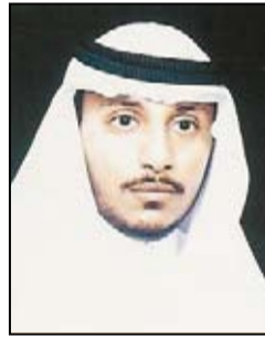
إعداد: عبد الحكيم هاشم

أنواع الأجسام المضادة في الجسم وتشتمل اليرود المناعية نتيجة لزيادة البروتين الدهني منخفض الكثافة. ٤. الوقاية من مرض السمنة وخطاره. ٥. الوقاية من تكون حصيات الكلى، إذ يرتفع معدل الصوديوم في الدم فيمنع تبلور املاح الكالسيوم ، كما ان زيادة مادة البولينا في البول تساعد في عدم ترسب املاح البول التي تكون حصيات المسالك البولية. ٦. الوقاية من اخطار السموم المتراكمة في خلايا الجسم وبين انسجته جراء تناول الأطعمة خصوصا المحفوظة منها والمصنعة، ومن تناول الادوية ، واستنشاق الهواء الملوث لهذه السموم. ٧. يخفف الصيام ويهدئ ثورة الغريزة الجنسية خاصة عند الشباب؛ فيبقى الجسم من الاضطرابات النفسية والجسمية وأثار الانحرافات السلوكية، وفي الحديث النبوي: ( فإنه له وجاء ) مبحث هام من مباحث الإعجاز العلمي ليس هنا مكان التوسع فيه. ٨. يعالج الصيام عددا من الأمراض الخطيرة منها: مرض تصلب الشرايين ، وضغط الدم ، وبعض أمراض القلب، وبعض أمراض البوردة الدموية الطرفية مثل الرينويد ومرض برجر، كما يعالج الصيام أيضا مرض التهاب المفاصل المزمن ( الروماتويد ) ، كما يعدل الصيام ارتفاع حموضة المعدة وبالتالي يساعد في التئام قرحة المعدة مع العلاج المناسب. ٩. أظهرت نتائج دراسة أعدتها باحثون من المعهد الوطني للتغذية في تونس زيادة مستويات الكوليسترول الحميد (HDL) عند الصائمين الأصحاء في شهر رمضان الكريم بنسبة وصلت إلى ٢٠٪ وهي من العوامل التي تقلل من مخاطر الإصابة بأمراض القلب والشرايين.