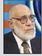
يقدم: د. زغلول النجار

يدور المحور الرئيس لسورة «الجن» حول العقيدة الإسلامية، وقد سميت بهذا الاسم لاستهلالها بالأخبار عن استماع نفر من الجن لتلاوة من القرآن الكريم وتأثرهم بها، وإيمانهم بما جاء فيها من حق ويرب العالمين وتزيهه تعالى عن الشريك والشبيهة والمنازع والصاحبة والولد.