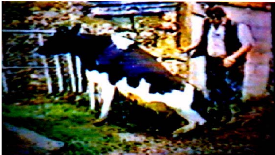
Bovine spongiform encephalopathy Hind limb ataxia