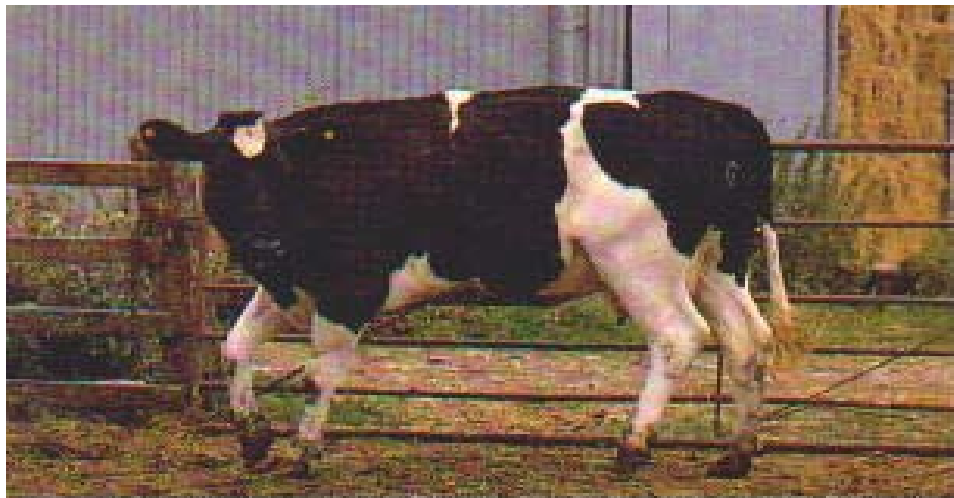
Bovine spongiform encephalopathy (BSE) arched back, and excessive straightness of hind legs as the animal turns to the left