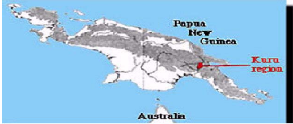
موقع غينيا الجديدة جنوب استراليا

ماذا يحدث لو أكل الإنسان لحم أخيه الإنسان