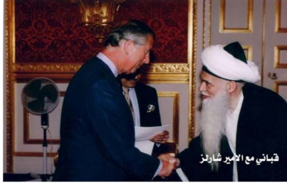
قبتاني مع الامير شارلز