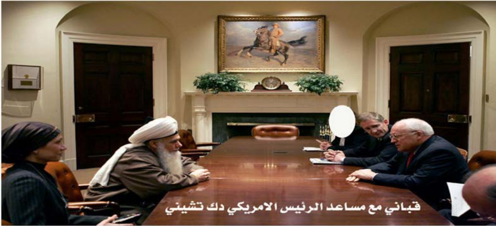
قبتاني مع مساعد الرئيس الامريكي دك تشيني