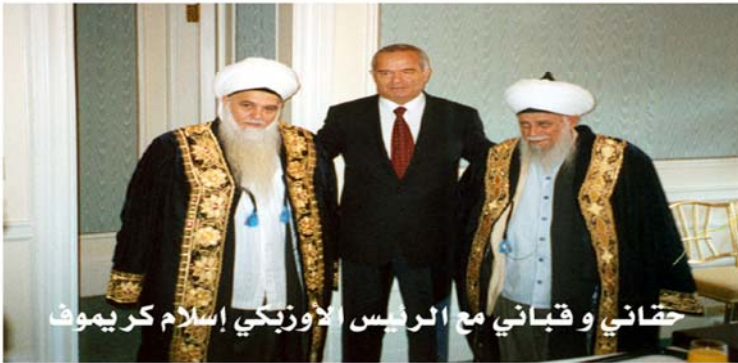
قبتاني و قبتاني مع الرئيس الاوزبكي اسلام كريموف