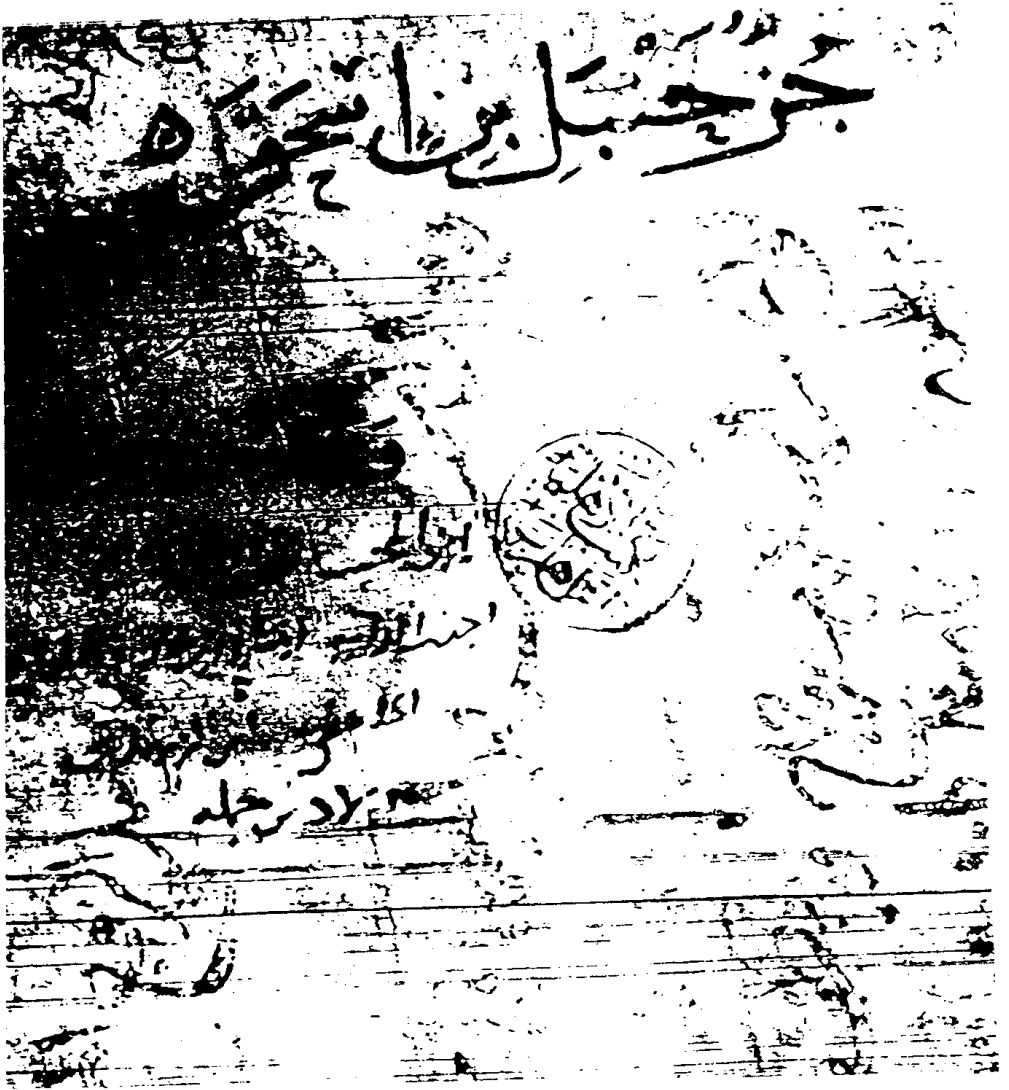
صورة عنوان الجزء