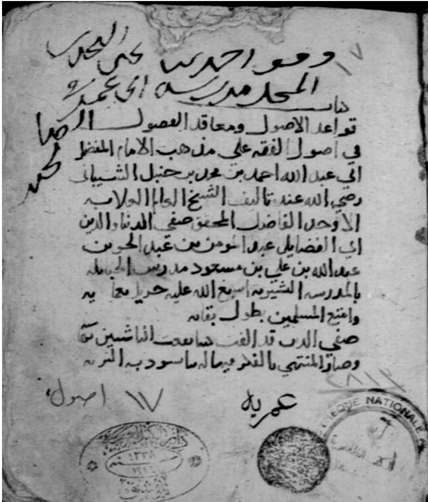
صورة الغلاف من النسخة (أ)