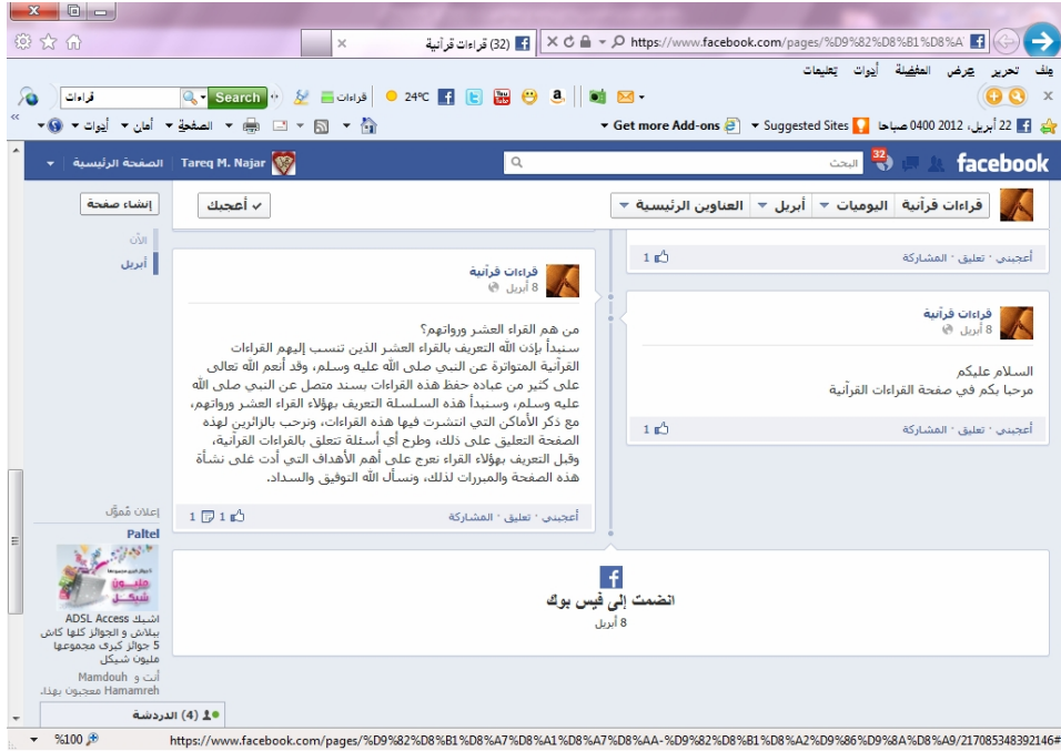
الشكل رقم ٤