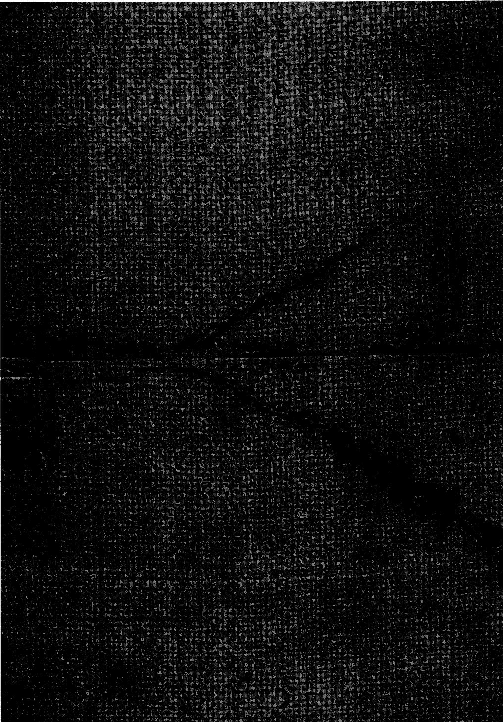
نموذج من مختصر متن الكافي