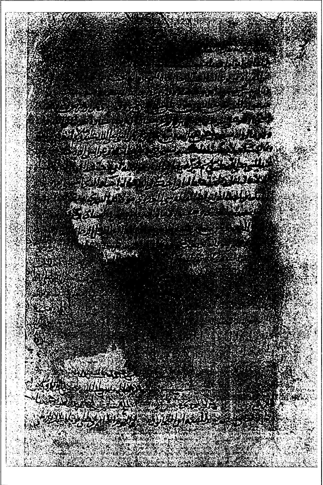
الصفحة الأخيرة من نسخة الجامعة العثمانية (هـ)