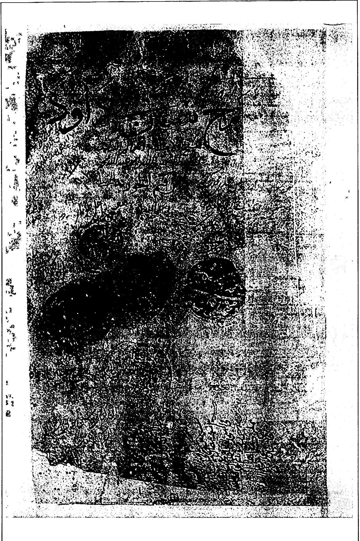
صفحة الغلاف من نسخة الجامعة العثمانية (هـ)