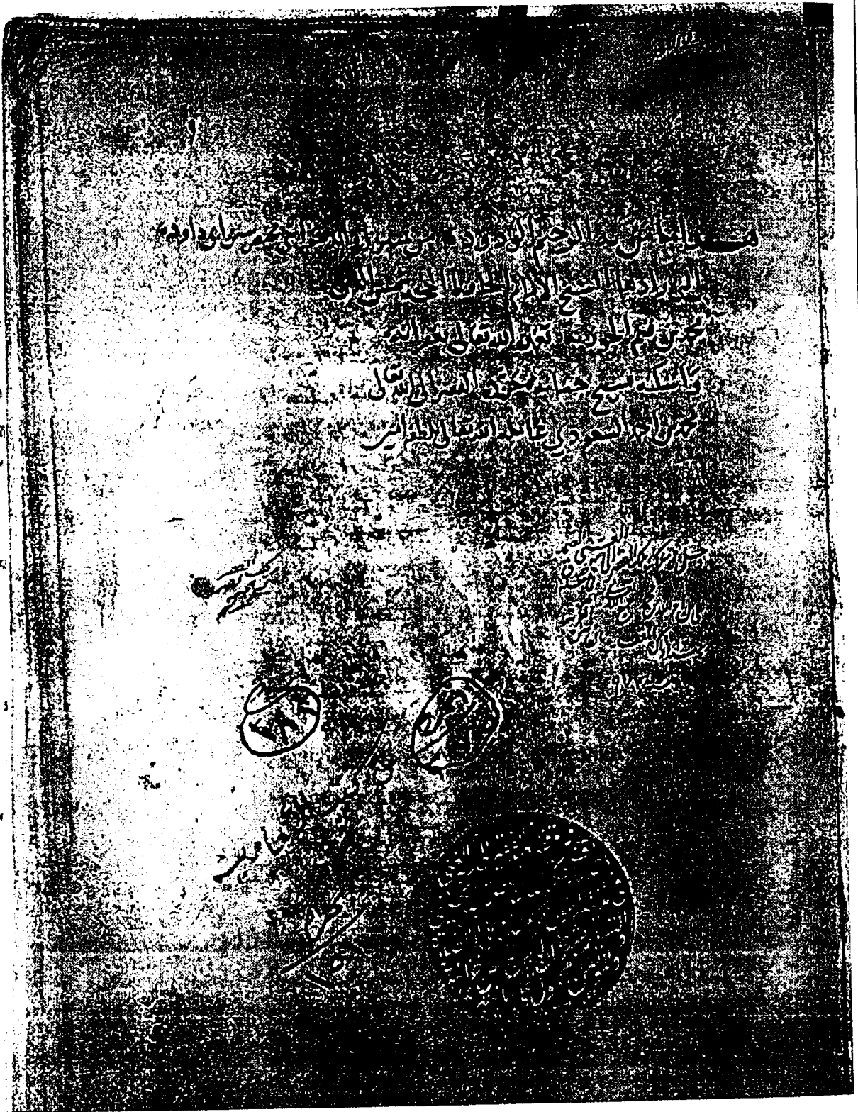
صفحة الغلاف من نسخة عارف حكمت (الأصل)