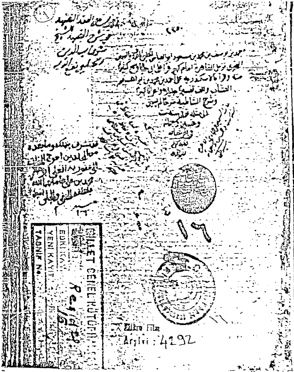
صورة صحيفة الغلاف من النسخة (ت)