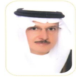
تقديم: معالي وزير الشؤون الاجتماعية الدكتور يوسف بن أحمد العثيمين

تحقق الكفاية الذاتية والاستدامة المالية في الجهات الأهلية