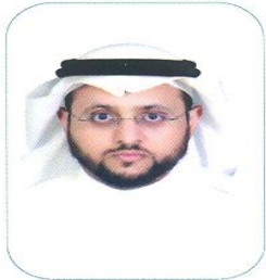
تأليف: د. محمد بن يحيى مفرح