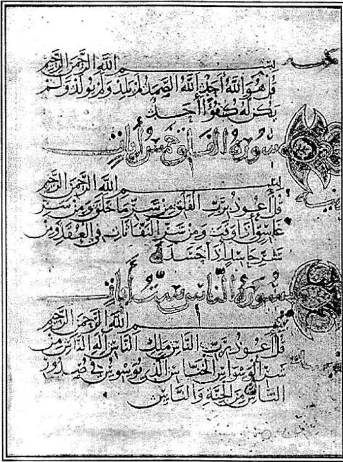
صفحة من مصحف ابن البواب المحفوظ في مكتبة جستريني