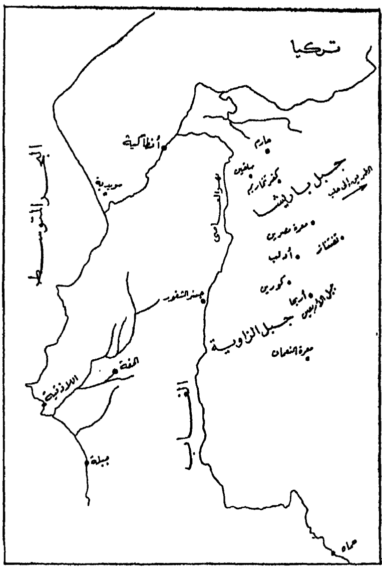
«المنطقة التي سيطر عليها الثوار السوريون بزعماء هنانو»