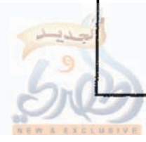
« صورة الخط الحديث الذي ألحق به النقص في أول نسخة (ب) »

حديث ابى هريرة مرثونا بن سره ان بعث مائة من الأيمان طليح المزلاحيه الألقه فيحاط بوليح قاله المتبع به مسلم قلت لم يجتمع به وقد وثق وذلك البشري فيه نظر حديث ابى هريرة أيضا مرثونا فمرقت المصدر على احد وسنين نرقه او اثنين وسبعين نرقه فيه محمد بن عمر بن ابى سلمة قال اصنع به مسلم قلت ما اصنع به مرثونا بلحظ من غير ان يبال باختمه الايمره حديث ابى هريرة ايضا مرثونا في سرد الاسماء الذي فيه عبدالعزيز بن مسمين قال وموثقة قلت على فعله وهو المماثل في مرثونا نودت احلت عليه بالبرجمل الله من له شعق من الإسلام كنه الاستقام له الخ فيه ما ذكره في آثاره في آلت ما خرج له سوى السائي قلت وفي حلاله سيدت حراية مرثونا بومه يالك في سيرته لا يالك ولا يزاله قال على شرفها ورواه الحارث بن سلمة قلت مطلقا في كتابه ان ما ذكره في سرد الاسماء هو الميراث لا الاشوخ ولم يثبته ابو بصير الاشوخ ورايت لابي اعمر في حراية مرثونا من انصارى مرثونا منه في الله وروى يشارك به شيئا اخبرته فان كان في شرفها ان كان في الله ورايت لابي اعمر في حراية مرثونا منه في الله وروى يشارك اسناده في حديثه في حراية مرثونا من انصارى مرثونا منه في الله وروى يشارك