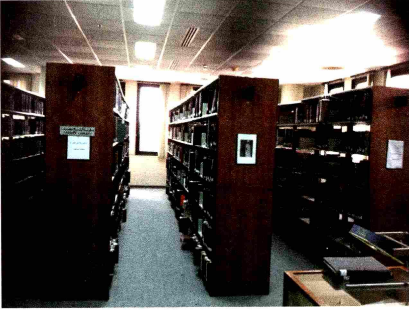
مكتبة الشيخ محمد نصيف بجامعة الملك عبدالعزيز