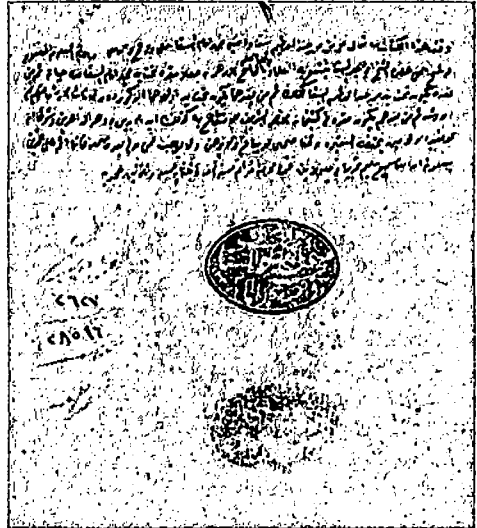
صورة الغلاف والصفحة الأولى من نسخة (أ)

بسم الله الرحمن الرحيم قال الامام الطحاوي هذا ذكر بيان عقيدة اهل السنة والجماعة علي مذاهب فقهاء الامة ابي حنيفة النعمان بن ثابت الكوفي وابي يوسف يعقوب بن ابراهيم الانصاري وابي عبد الله محمد بن الحسن الشيباني وما يمتدونه من اصول الاديان ويدعون به لرب العالمين يقول في توحيد الله تعالى معتقدين بتوفيق الله ان الله واحد لا شريك له ولا شيء مثله ولا شيء يحويه ولا له غيره قديم بلا ابتداء دائم بلا انقضاء لا ينفخ ولا يبسط ولا يكون الا ما يريد لا يتلفه الا وهما ولا تدركه الاضداد ولا يشبهه الا نام وهو حي لا يموت قديم لا ينتمى خالق بلا حاجة والله هو الغني المطلق رازق بلا مونة سميت بلا مخافة باعث بلا منعة مازال بصنائه قديما قبل