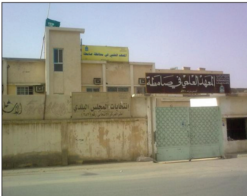
المعهد العلمي بمحافظة صامطة (حاليًا) وقد أسسه الشيخ رحمه الله عام ١٣٧٤هـ