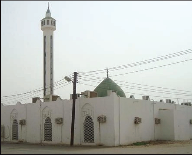
جامع الراحة: بجوار دكان الدعوة وفيه انطلقت الدروس العلمية