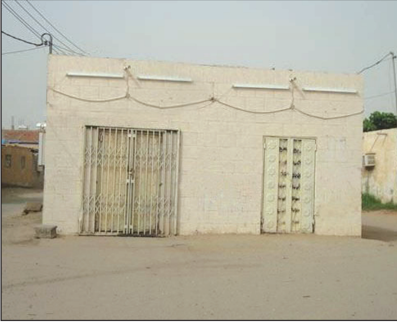
دكان الدعوة بصامطة: أول مكان نزل فيه الشيخ وبدأ دعوته الإصلاحية