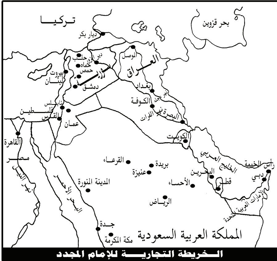
بعض الدول والمدن التي زارها الإمام في رحلاته التجارية

استقر الشيخ في موطنه، وتزوج زواجه الأول (١) - وهو ابن خمس وعشرين سنة - وأقام ما شاء الله أن يقيم في عنيزة، وعزم بعد ذلك على السفر للتجارة مرة أخرى، فاشترى إبلاً من عنيزة، وتوجه إلى بلاد الشام، وباعها في حلب، وفلسطين، ثم عاد بعد هذه الرحلة إلى موطنه، وأعدَّ العُدَّة، واتجه إلى الأحساء، ثم إلى البحرين، وفي هذه المرة بدأ الشيخ يجمع بين تجارة الإبل والأقمشة، فاشترى من البحرين بعض الأقمشة، وباعها في الأحساء، ثم اشترى من الأحساء إبلاً، وتوجه من جديد إلى بلاد الشام وفلسطين، ثم إلى مصر وباعها هناك.