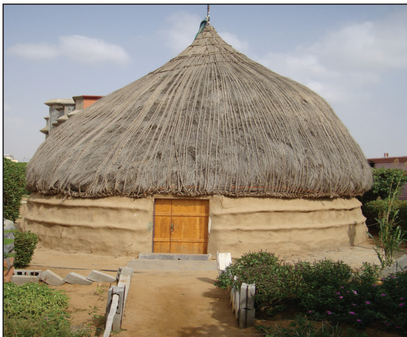
هيئة البيوت والمباني في تلك الفترة