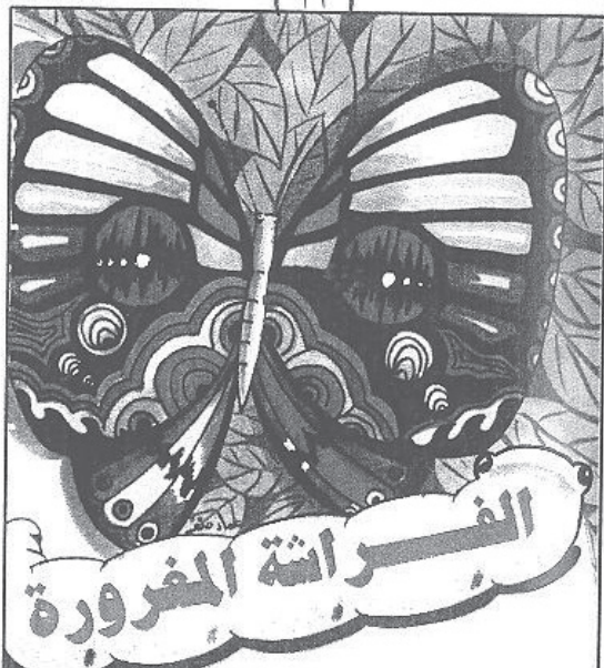
صغيرة تسير ببطء على ورق شجرة الأرز شجرة النور الخيرة، ورود الفز كات عبيمة ولو لم تكن جميلة مثل الفراشة.