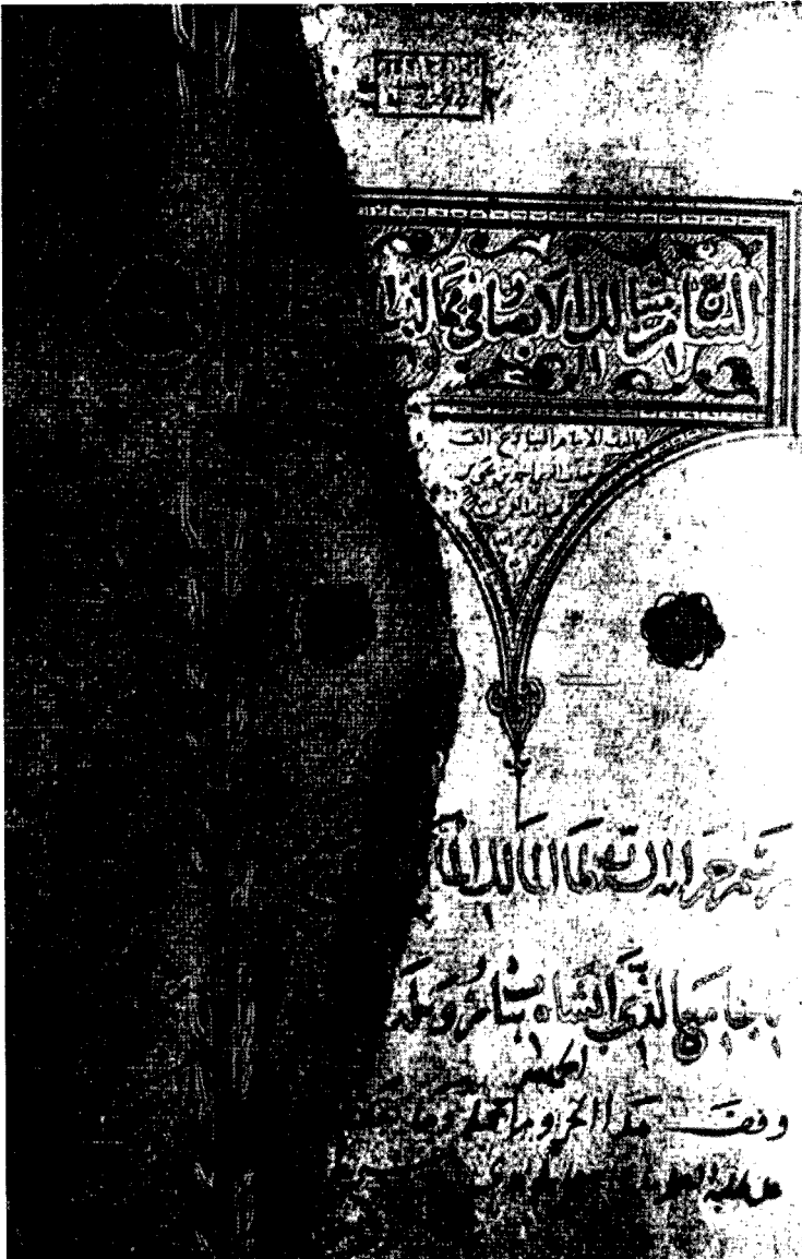
صفحة العنوان - مخطوطة أحمد الثالث - طوبقو سراي - استانبول - رقم ٢٧٩٧