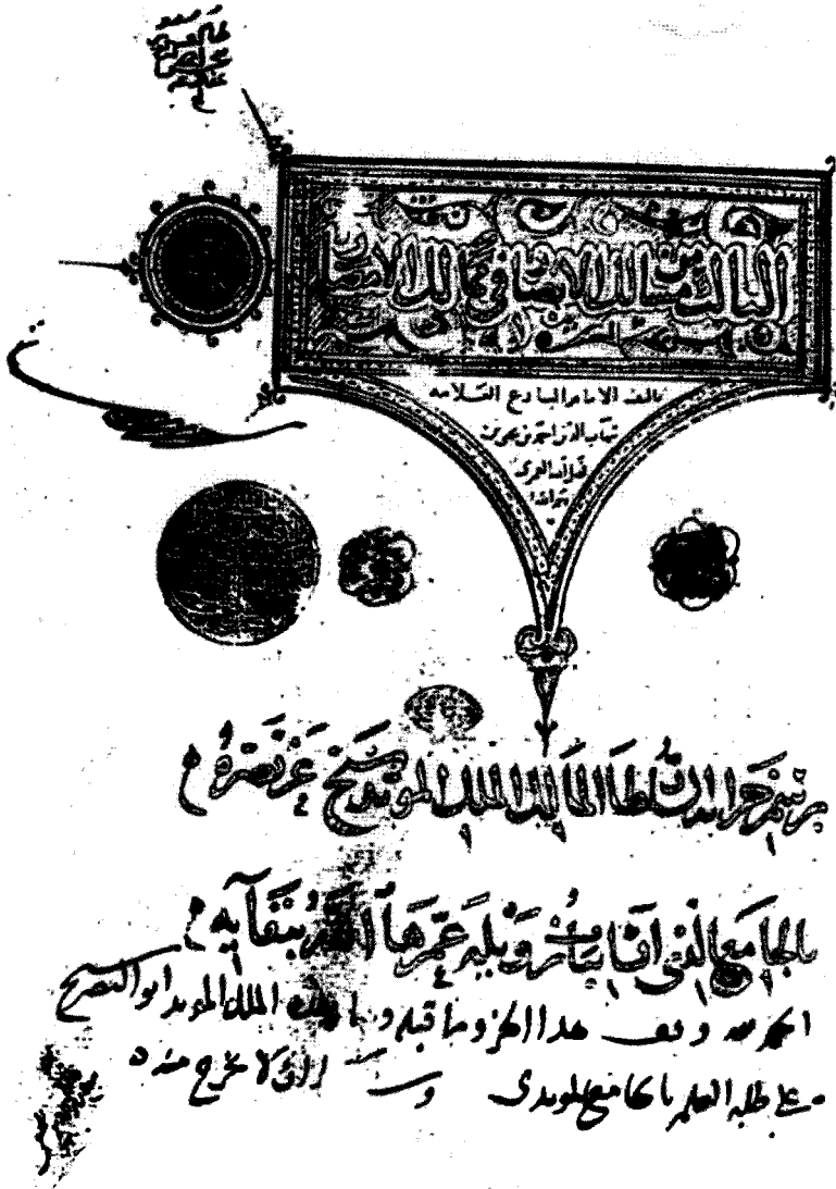
الصفحة ١١١ من مخطوطة أحمد الثالث وتمثل عنوان الجزء الثالث من المسالك