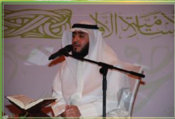
الشيخ فهد الكندري يتلو آيات الافتتاح