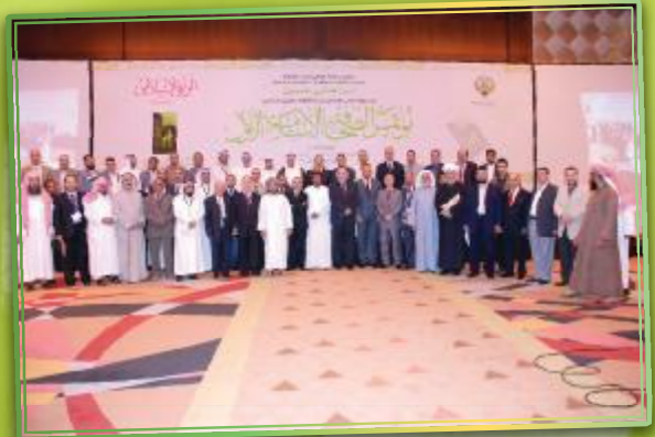
صورة جماعية للحضور