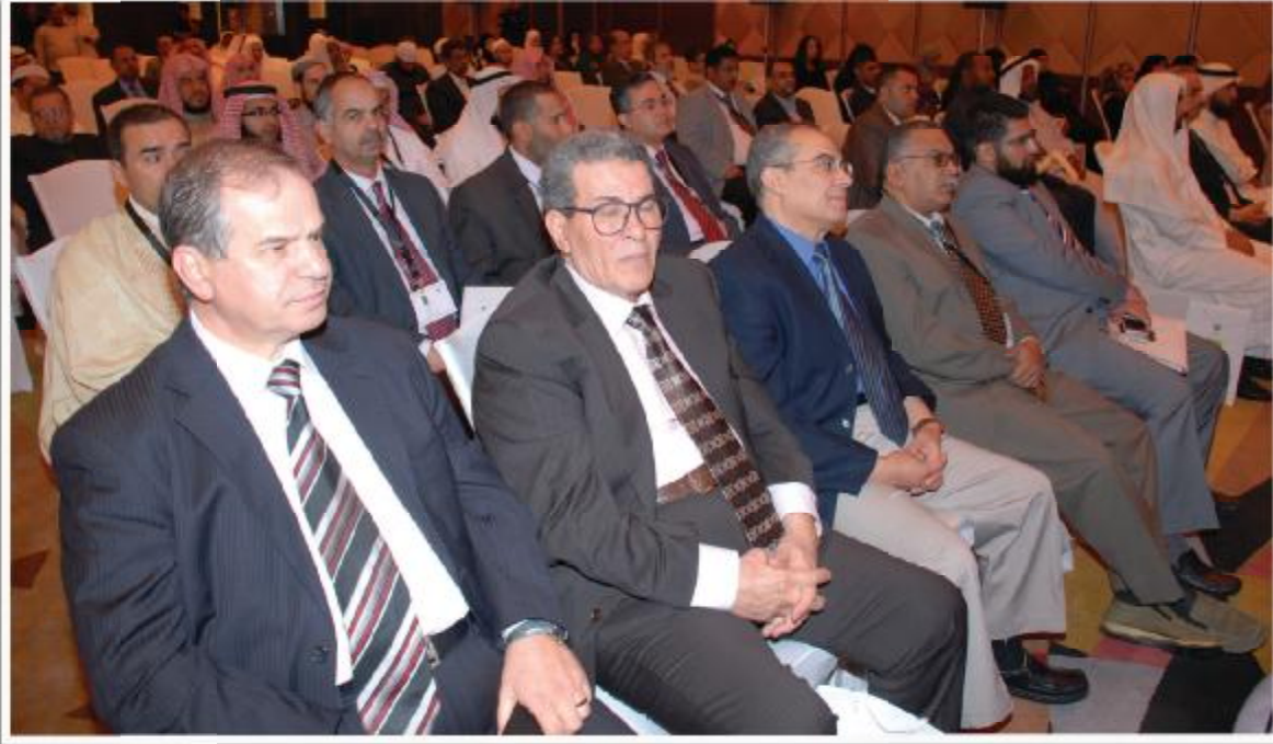
جانب من الحضور في افتتاح المؤتمر

ووضوح، تعرّض الإسلام في ثوب قشيب محبب للقراء، وتسهم في النهضة الفقهية التشريعية التي يتطلّبها مجتمعنا.. مضيئاً: إنه لا أدل على أن «الوعي الإسلامي» وُقِّمَت كل التوفيق ونجحت غاية النجاح، من هذا الحضور المشهود لها في العالم العربي والإسلامي، وهذه المتابعات الحثيثة من قرائها على اختلاف ثقافتهم وتوجهاتهم واهتماماتهم.