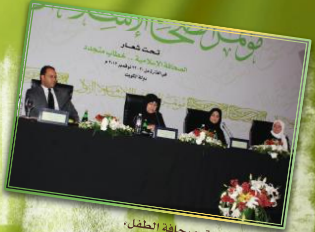
جانب من ندوة «صحافة الطفل»