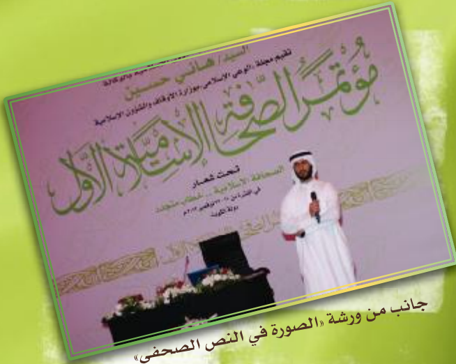
جانب من ورشة «الصورة في النص الصحفي»