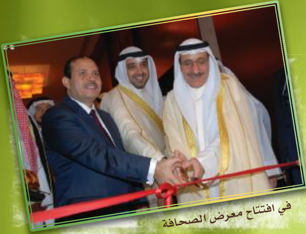
في افتتاح معرض الصحافة