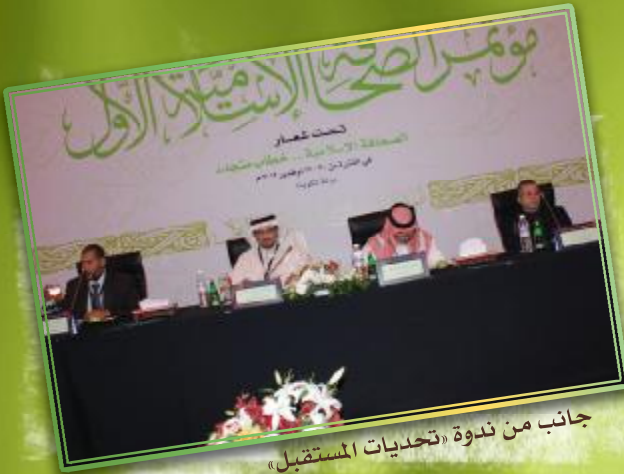
جانب من ندوة «تحديات المستقبل»