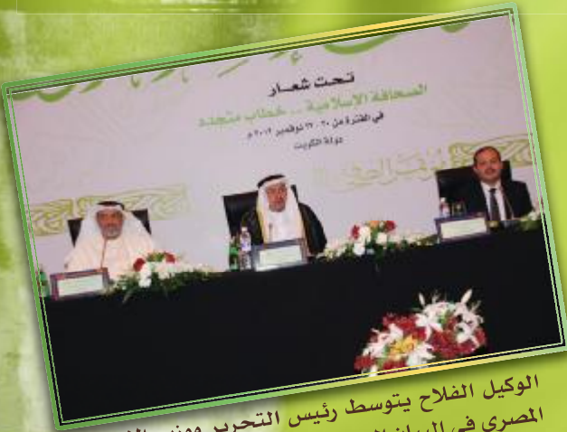
الوكيل الفلاح يتوسط رئيس التحرير ووزير الإعلام المصري في البيان الختامي