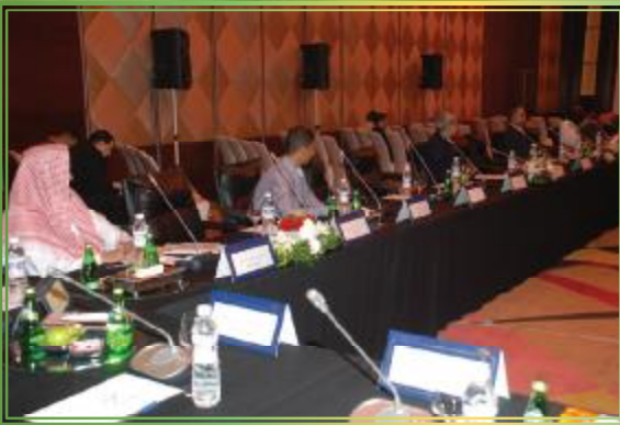
لقطة لضيوف المؤتمر المحاضرين