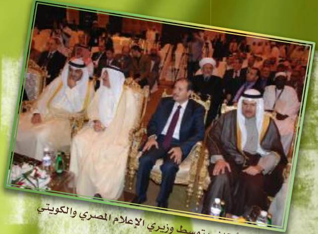
وزير الأوقاف يتوسط وزير الإعلام المصري والكويتي