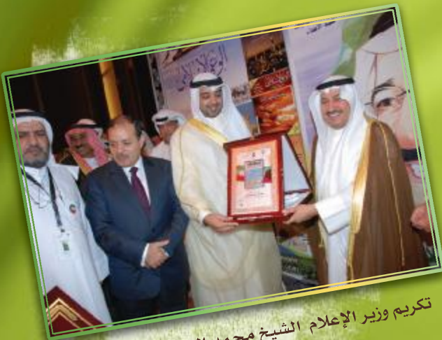
تكريم وزير الإعلام الشيخ محمد العبدالله