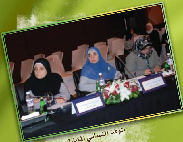
الوفد النسائي المشارك