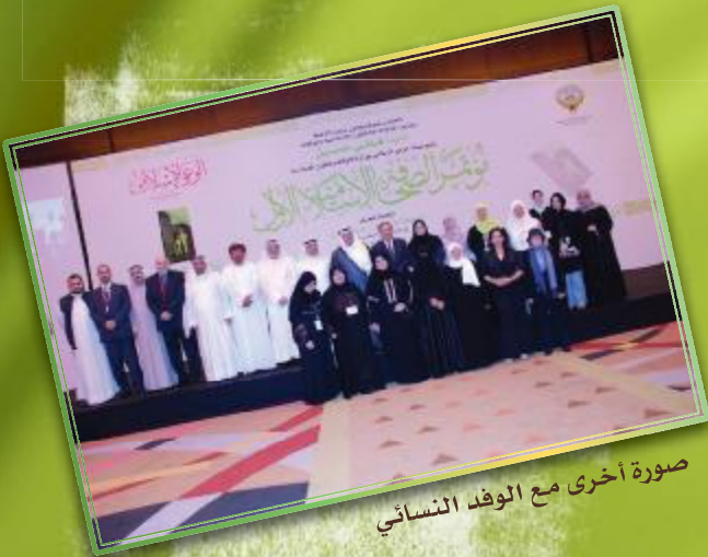
صورة أخرى مع الوفد النسائي