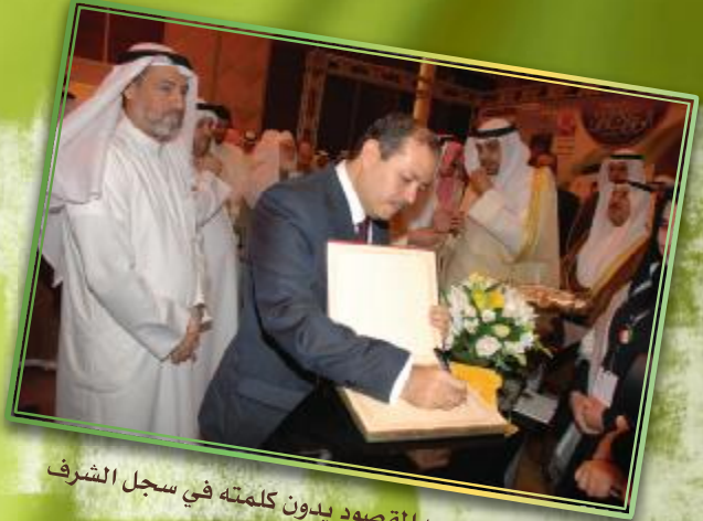
الوزير صلاح عبدالمقصود يدون كلمته في سجل الشرف