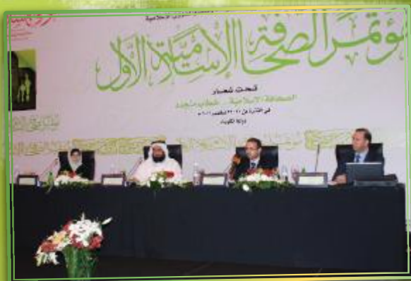
جانب من ندوة «القواسم المشتركة بين الصحافة الإسلامية والتقليدية»