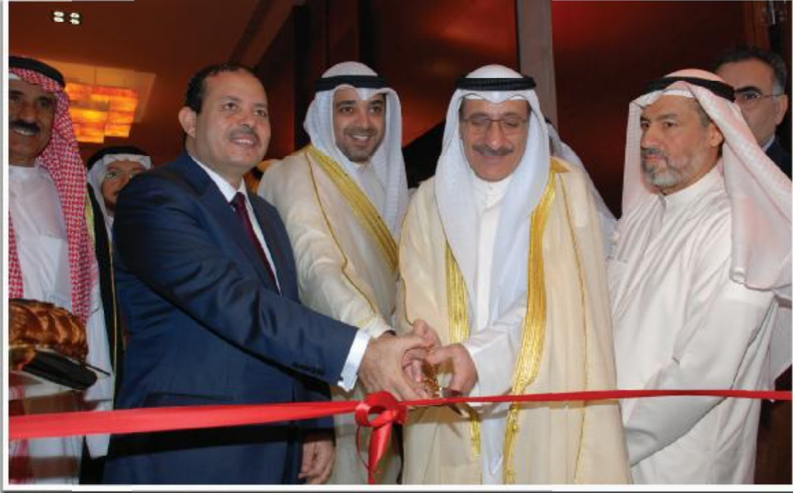
وزراء الأوقاف والإعلام الكويتي والمصري يفتتحون معرض الصحافة الإسلامية بحضور رئيس التحرير

الله واختصهم بذلك الفضل، وكان المرسل الكرام في طليعة هؤلاء الدعاة، مصداقاً لقوله تعالى: ﴿ادْعُ إِلَى سَبِيلِ رَبِّكَ بِالْحُكْمِ وَالْمَوْعِظَةِ الْحَسَنَةِ﴾، وكان من سمات الدعوة إلى الله التجدد والتنوع والتطور، نظراً لما تستهدفه من أفهام وعقول وثقافات مختلفة، ولذلك على الداعين إلى الله تجديد وسائلهم وتطويرها.