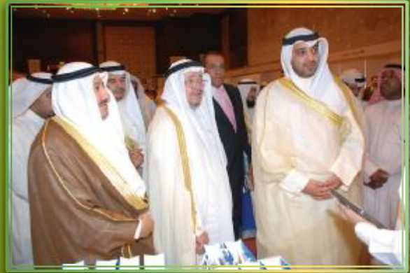
الوكيل الفلاح يتوسط الوزير عبدالله والوكيل المساعد الأدينة