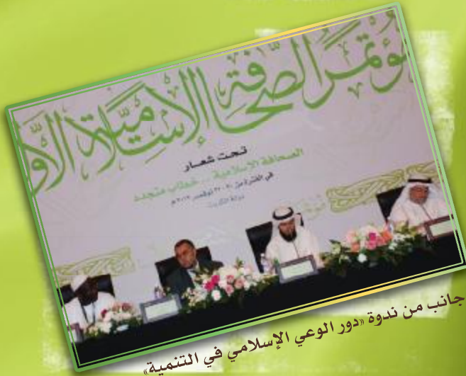
جانب من ندوة «دور الوعي الإسلامي في التنمية»