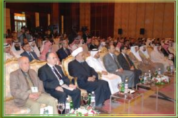
حفل افتتاح المؤتمر