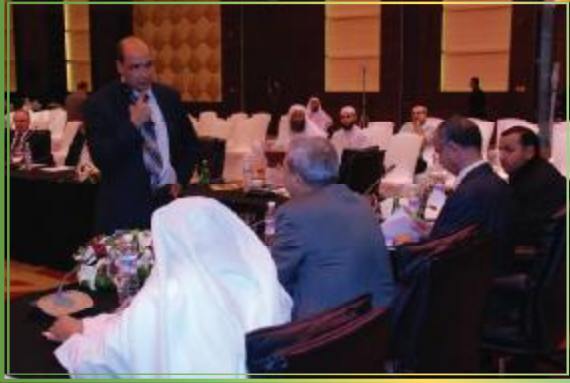
نقاشات وتطبيقات في ورشة «الصحافة الإستقصائية»