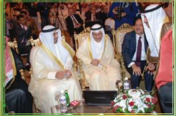
الوزراء لحظة تدشين موقع الوعي الشبابي