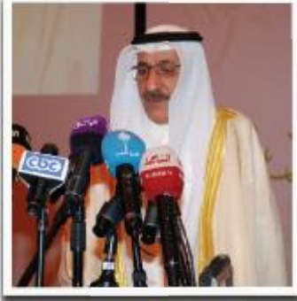
وزير الأوقاف هاني حسين