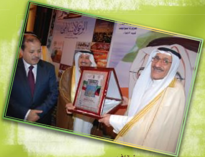
تكريم وزير الأوقاف