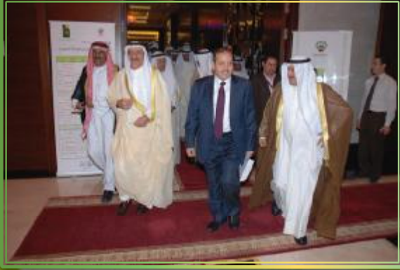
لحظة دخول قاعة المؤتمرات