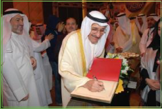
الوزير هاني حسين يدون كلمته في سجل الشرف