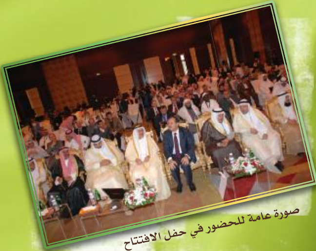
صورة عامة للحضور في حفل الافتتاح