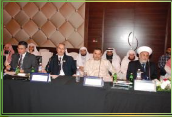
نويري ونصيب ونصار ضمن الحضور