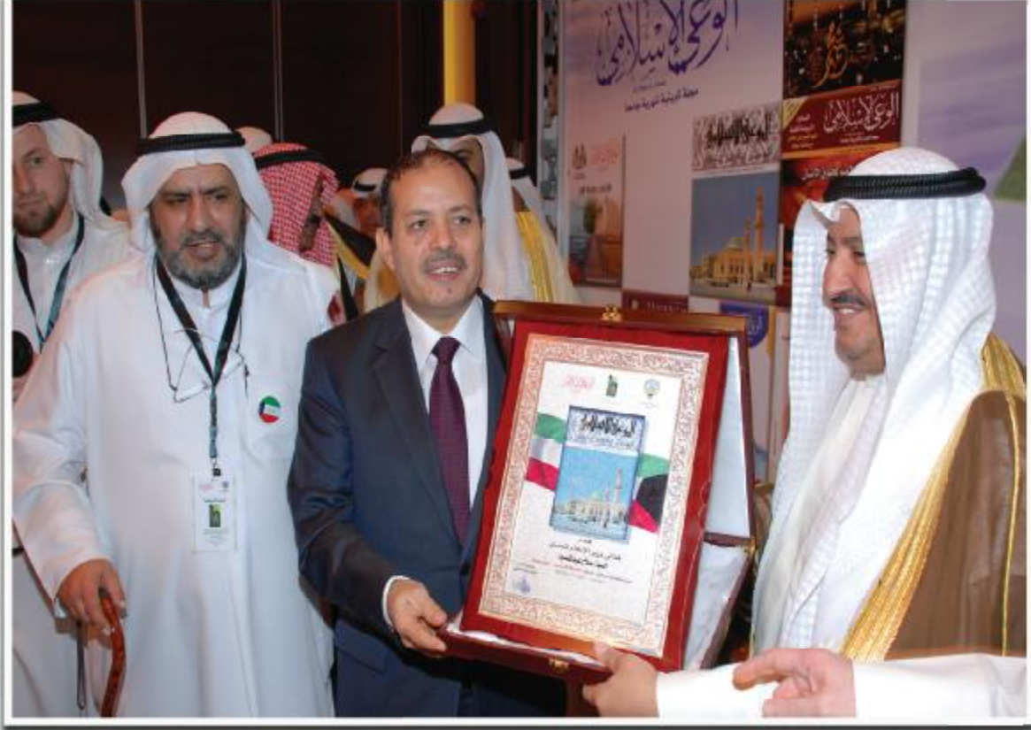
وكيل الثقافة الأدينية يكرم وزير الإعلام المصري

المستقبلية الواعدة على صفحاتها وبين دفاتها، وهما هي اليوم تجمع صفوة المختصين والمعنيين على طاولتها لتتباحث معهم في مؤتمرها الصحفي الأول حول «الصحافة الإسلامية.. فكر متجدد»، لتتلاقى ثمار هذا الفكر النير، عسى أن تكون سراجاً يستضيء به العاملون في الصحافة الإسلامية، لاسيما المكتوب منه.