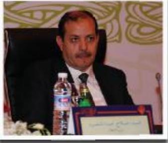
وزير الإعلام المصري صلاح عبد المقصود