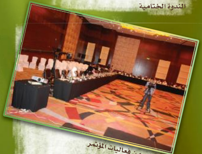
جانب من فعاليات المؤتمر