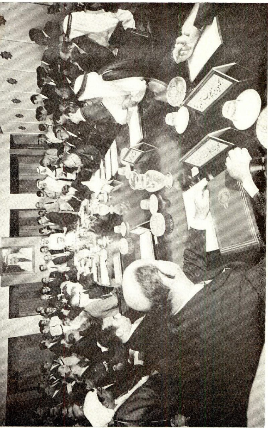
مؤتمر وزراء خارجية العرب الذي عقد بالكويت في قصر السلام وذلك في يوم السبت ٩ ربيع الأول ١٣٨٧ هـ - ١٧ يونيو ١٩٦٧ م