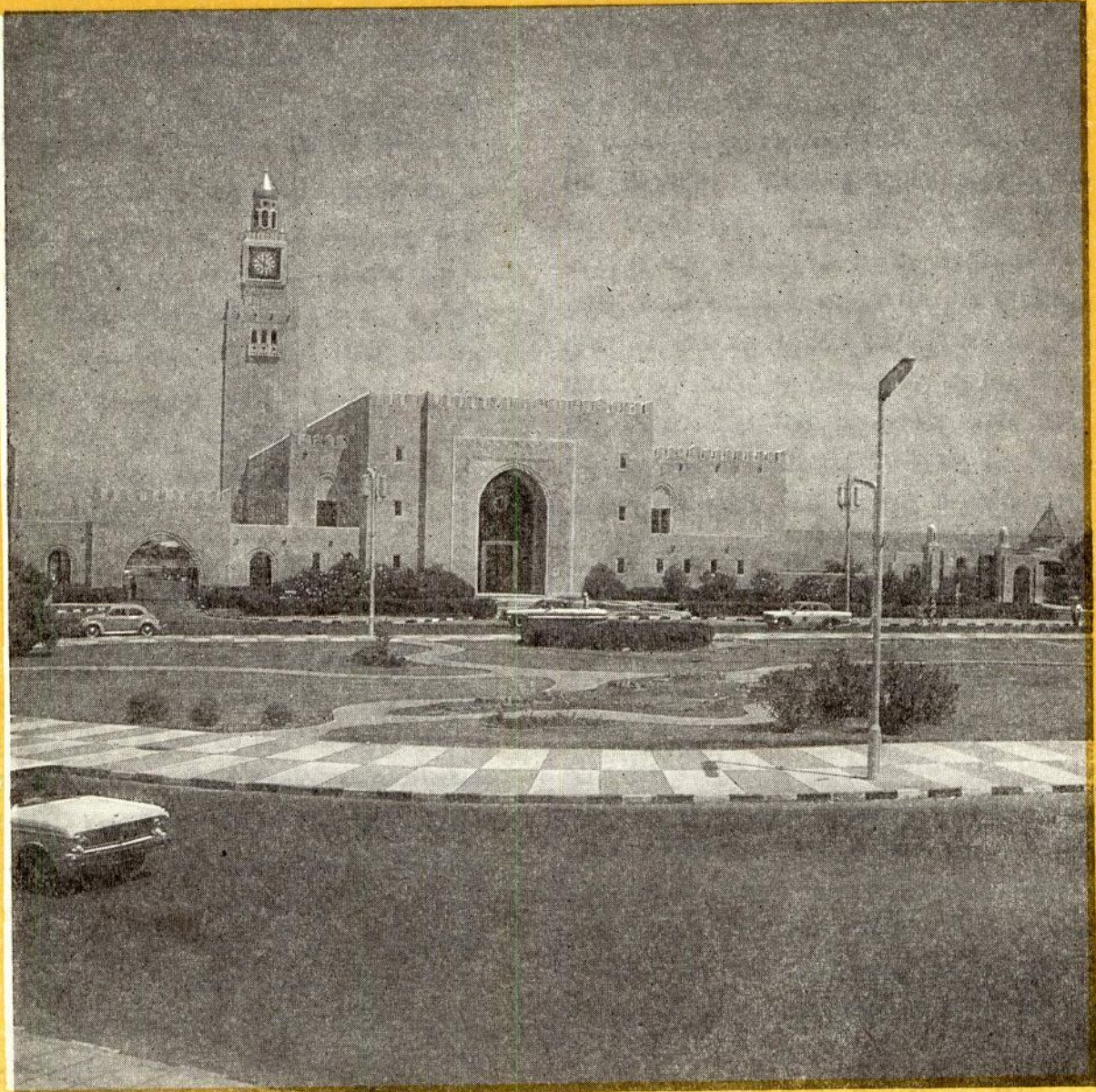
قصر السيف العامر . على شاطئ الخليج المقر الرسمى لصاحب السمو الامير المعظم

والوعى الاسلامى تنتهز هذه المناسبة الكريمة فترفع الى حضرة صاحب السمو الامير المعظم وسمو ولي عهده المحبوب ورجال حكومته والشعب الكويتى عامة أصدق آيات التهانى ضارعة الى الله عز وجل أن يعيد هذا العيد السعيد على البلاد بالرفاهية والعزة والسعادة .