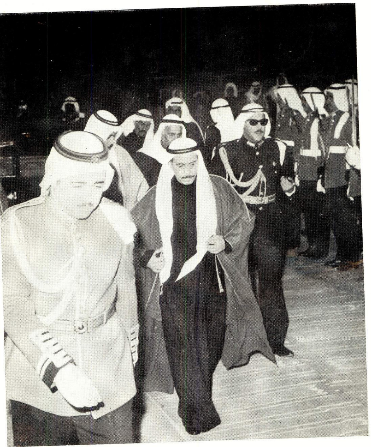
سمو امير البلاد المعظم في طريقه الى مسجد السوق الكبير لصلاة عيد الفطر المبارك