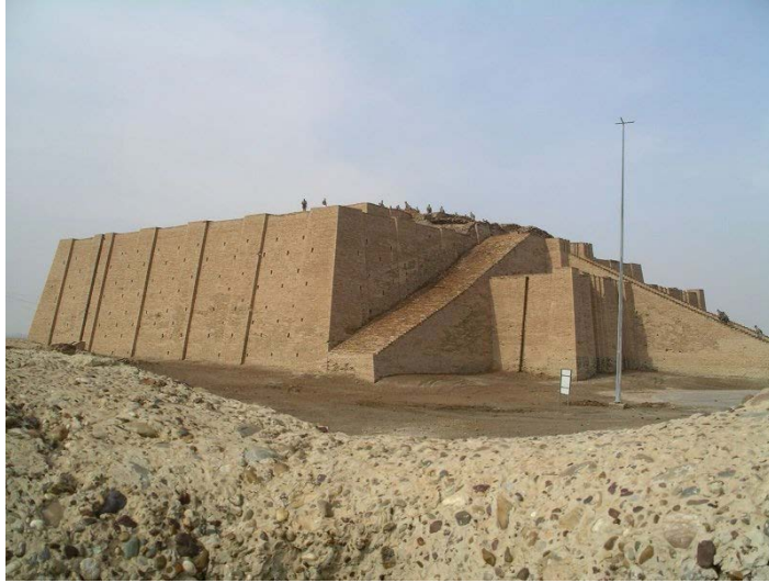
Der große Ziggurat von Ur, der Tempel des Mondgottes Nanna, auch als Sin bekannt. Aufgenommen 2004, das Foto ist im Besitz von Lasse Jensen.